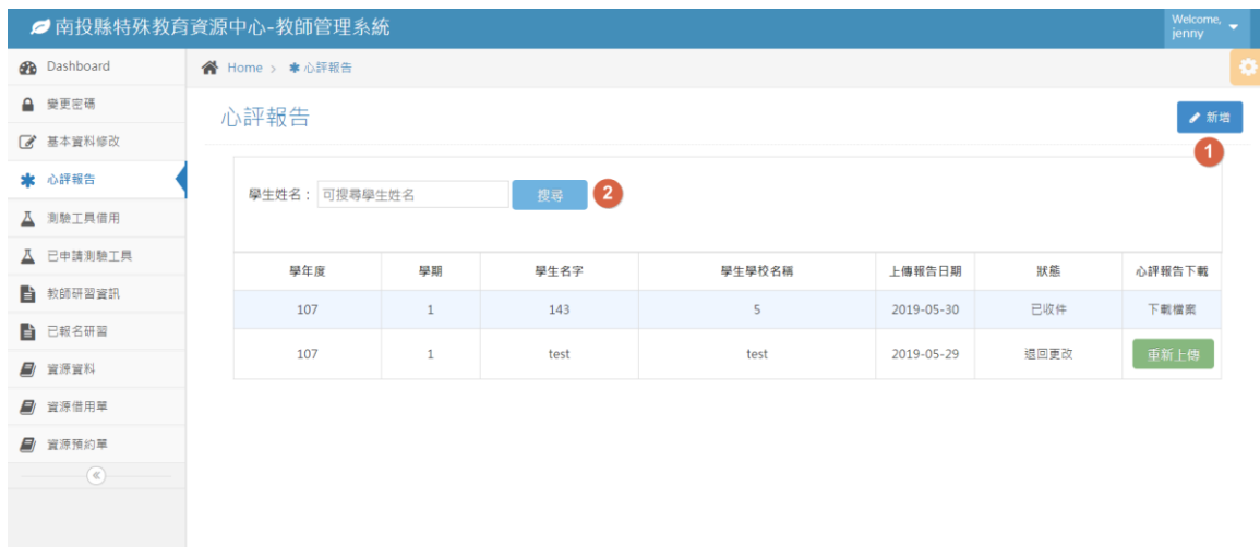
圖 2 心評報告列表介面