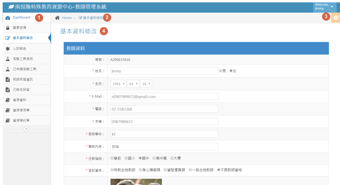
圖 1 KFOX 網站管理平台管理介面