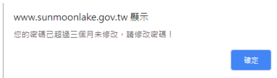
圖 5 密碼逾期通知